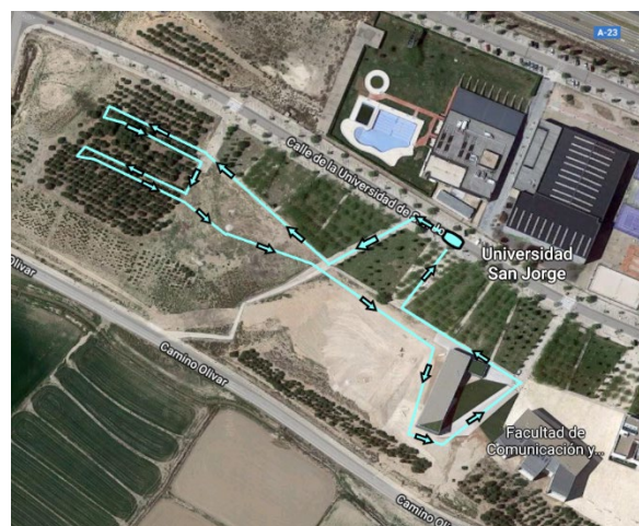
Recorrido de BTT para las categorías Iniciación y Benjamín.