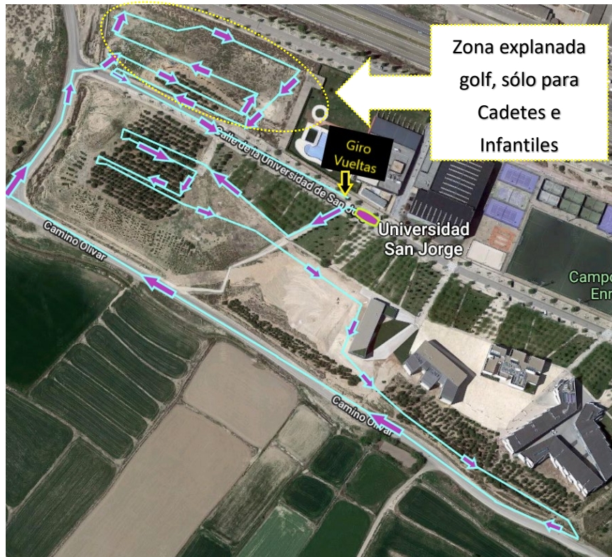
Recorrido de BTT para las categorías alevín, infantil y cadete.

Se realizará con bicicleta de montaña y consta de un recorrido de 2,7 km por vuelta para las categorías Infantil y Cadete. Un recorrido de 2km por vuelta para categoría Alevín. Y un recorrido de 1km por vuelta para las categorías iniciación y benjamín.