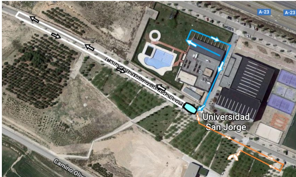
Recorridos triatlón promoción